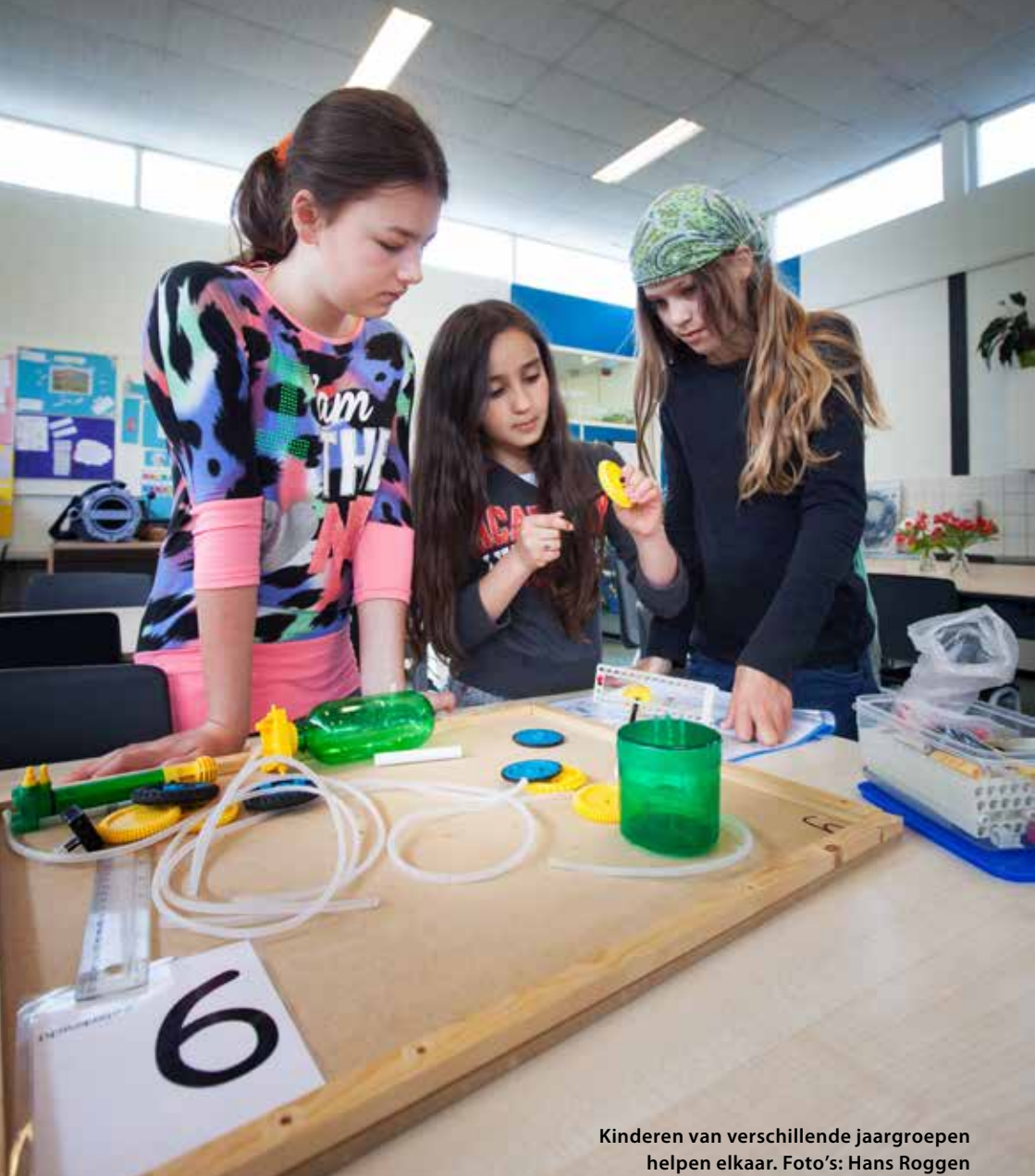
Kinderen van verschillende jaargroepen helpen elkaar.