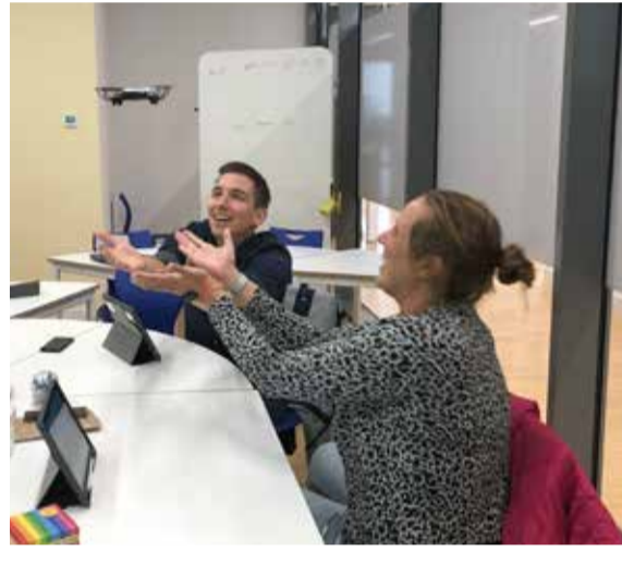
Onderzoeksgesprekken met andere labs